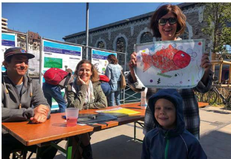
Par exemple : atelier de dessins pour les enfants à Genève en 2021